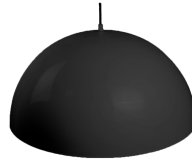
Рисунок 1 - Внешний вид светильника

Диапазон напряжений питающей сети, В – 176-264; Номинальная частота питающей сети, Гц – 50-60; Класс защиты от поражения электрическим током – II; Класс светораспределения – П; Тип монтажа: подвесной, метизы; Диапазон рабочих температур, °С – 0/+40; Коэффициент пульсаций – <5%; Коэффициент мощности – >0,95; Источник света – светодиодная лампа SDS; Внешний вид согласно Рис.1 Виды исполнений согласно Таб. 1;