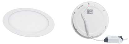
Рисунок 1 - Внешний вид светильника

Диапазон напряжений питающей сети, В – 176-264; Номинальная частота питающей сети, Гц – 50-60; Класс защиты от поражения электрическим током – II; Класс светораспределения – П; Тип монтажа: встраиваемый, пружинный механизм; Диапазон рабочих температур, °С – -10/+40; Коэффициент пульсаций – <5%; Коэффициент мощности – >0,95; Тип /Материал рассеивателя - опал; Источник питания (драйвер)- SDS; Источник света– светодиоды Samsung; Внешний вид согласно Рис.1 Виды исполнений согласно Таб. 1;