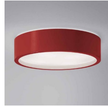
Рисунок 1 - Внешний вид светильника

Диапазон напряжений питающей сети, В – 176-264; Номинальная частота питающей сети, Гц – 50-60; Класс защиты от поражения электрическим током – II; Класс светораспределения – П; Тип монтажа: подвесной, тросы; Диапазон рабочих температур, °С – 0/+40; Коэффициент пульсаций – <5%; Коэффициент мощности – >0,95, >0,55; Тип /Материал рассеивателя - матовый (ПВХ); Источник света- светодиодная лампа SDS; Внешний вид согласно Рис.1 Виды исполнений согласно Таб. 1;