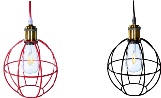
Рисунок 1 - Внешний вид светильника

Диапазон напряжений питающей сети, В – 176-264; Номинальная частота питающей сети, Гц – 50-60; Класс защиты от поражения электрическим током – II; Класс светораспределения – П; Тип монтажа: подвесной, метизы; Диапазон рабочих температур, °С – 0/+40; Коэффициент пульсаций – 3%; Коэффициент мощности – >0,95; Источник света – филаментная лампа SDSBET; Внешний вид согласно Рис.1 Виды исполнений согласно Таб. 1;