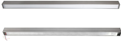
Рисунок 1 - Внешний вид светильника

Диапазон напряжений питающей сети, В – 176-264; Номинальная частота питающей сети, Гц – 50-60; Класс защиты от поражения электрическим током – I; Класс светораспределения – П; Тип монтажа: накладной, скоба; подвесной, тросы; Диапазон рабочих температур, °С – 0/+40; Коэффициент пульсаций – <1%; Коэффициент мощности – >0,95; Тип /Материал рассеивателя - опал (PS); Источник питания (драйвер)- Апрос-Трейд, SDS; Источник света– светодиоды Seoul Semiconductor; Внешний вид согласно Рис.1 Виды исполнений согласно Таб. 1;